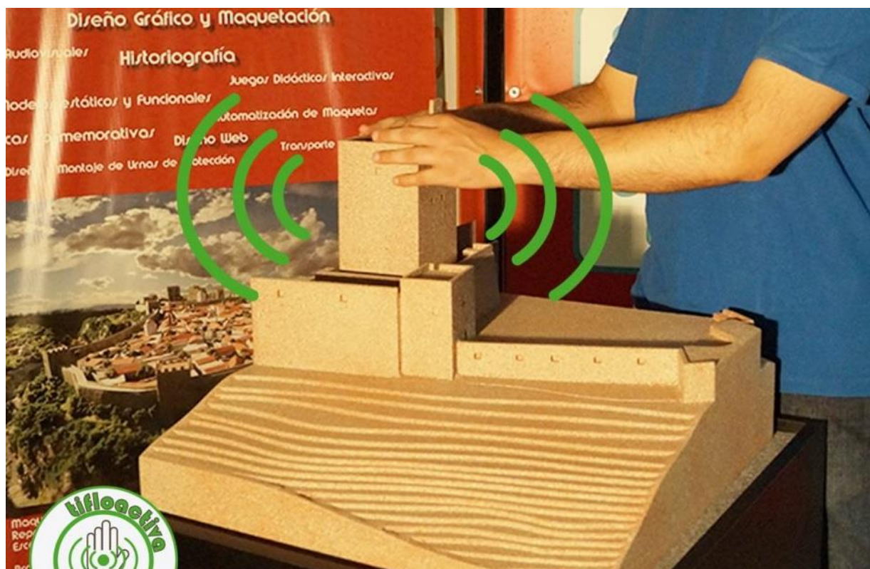
Persona tocando una maqueta con sensores Tifloactiva

Tifloactiva es un recurso innovador pensado especialmente para el público infantil, en el menú de su app se pueden seleccionar, si se desea, que la maqueta dé respuestas especialmente desarrolladas para los niños, o para el público adulto.